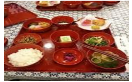
総持寺・精進料理の一例

総持寺は、元々石川県に在りました。それが鶴見の地に移転したのです。古い話ですが、後醍醐天皇が石川県にいらしたそうです。その時に、曹洞宗の本山は総持寺である。次いで永平寺とする。そう勅令があり、大本山を名乗る事を許されたとの経緯があるそうです。御霊殿（後醍醐天皇廟内）は見学出来ない